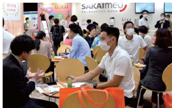
※CareTEX札幌'23の会場の様子