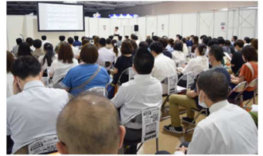
※CareTEX札幌'23のセミナーの様子

受講申込(無料)は公式サイトにて受付中。定員間近のセッションもあるため、早めの申込をおすすめする。